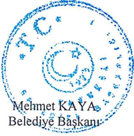
Mehmet KAYA Belediye Başkanı

5393 sayılı Belediye Kanununun 18. Maddesi (e) bendi gereği 08.05.2024 tarih ve 9 sayılı Plan ve Bütçe Komisyon Raporunun geldiği şekli ile kabulüne işaret ile yapılan oylamada oy birliği ile karar verildi.